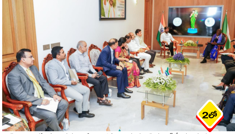
తెలంగాణ, దక్షిణాఫ్రికా మధ్య వాణిజ్య, ఆర్థిక బంధవారం హైదరాబాద్లో ముఖ్యమంత్రి సంబంధాలను బలోపేతం చేసే దిశగా కీలక అడుగుపడింది. రేవంత్ రెడ్డితో దక్షిణాఫ్రికా డిప్యూటీ ప్రెసిడెంట్ షిపోకోసా - మిగతా 2 లో