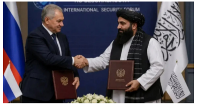
అంతర్జాతీయ రాజకీయాల్లో ఒక సంవత్సరం పరిణామం చోటుచేసుకుంది. ఆఫ్ఘనిస్థాన్లోని తాలిబాన్ ప్రభుత్వంతో రష్యా తన మొట్టమొదటి అధికారిక సైనిక-సాంకేతిక సహకార ఒప్పందాన్ని కుదుర్చుకుంది. మాస్కోలో జరిగిన అంతర్జాతీయ - మిగతా 2 లో