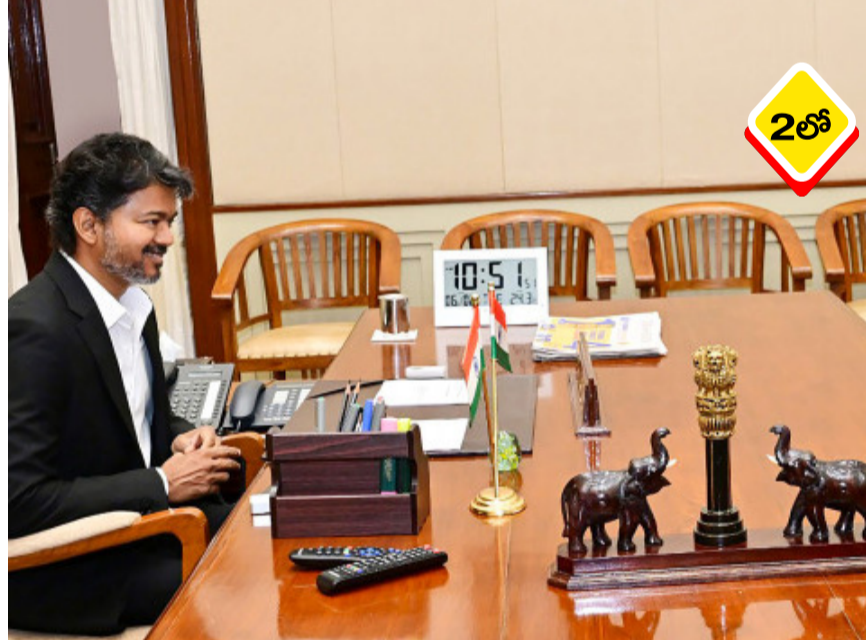
తమిళనాడు రాజకీయాల్లో కీలక పరిణామం చోటుచేసుకుంది. రాష్ట్రంలో అధికారంలో ఉన్న తమిళగ వెన్కటేశ్వర్ల కళగం (టీవీకే) పార్టీ, తమ కూటమి భాగస్వామి అయిన కాంగ్రెస్ కు రాజ్యసభ స్థానాన్ని - మిగతా 2 లో