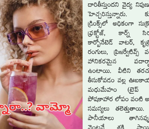
చల్లగా ఉంటుందని తాగుతున్నారా...? వామో

వేసవిలో ఉపశమనం కోసం తాగే శీతల పానీయాల ఆరోగ్యానికి హానికరం. అధిక సుక్రోజ్, హానికర రసాయనాల వల్ల ఉబకాయం, మధుమేహం, దంత సమస్యలు, ఫ్యాటీ లివర్ వంటి రోగాలు వస్తాయని నిపుణులు హెచ్చరిస్తున్నారు. మజ్జిగ, నిమ్మరసం, కొబ్బరినీళ్లు వంటి సహజ పానీయాలు ఆరోగ్యానికి శ్రేయస్కరమైన ఆరోగ్య నిపుణులు చెబుతున్నారు. ఎండల దంబికాయతన్నాయి.. భానుడి భగభగలు, ఉక్కుపోత, వేసవిపాతంతో జనం అల్లాడుతున్నారు. ఎండ నుంచి ఉపశమనం పొందడానికి చాలామంది శీతల పానీయాలను ఆశ్రయిస్తుంటారు. దీంతో కూల్ డ్రింక్స్ కు భారీగా డిమాండ్ ఏర్పడుతుంది. అయితే, ఈ పానీయాలు తాత్కాలికంగా చల్లదనాన్ని ఉపశమనాన్ని కలిగించినప్పటికీ, వాటిలో ఉండే అధిక సుక్రోజ్ దీర్ఘకాలికంగా అనేక అనారోగ్య సమస్యలకు