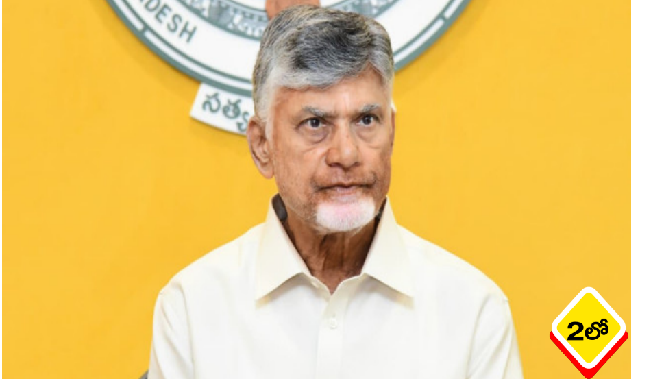
ప్రత్యర్థి పార్టీకి విమర్శలు, విధ్వంసం తప్ప మరేమీ చేతకాదని, వారిని గొడ్డలి పార్టీగా అభివర్ణిస్తూ ముఖ్యమంత్రి చంద్రబాబు తీవ్ర స్థాయిలో విరుచుకుపడ్డారు. అమరావతిలో బుధవారం ఏర్పాటు చేసిన - మిగతా 2 లో