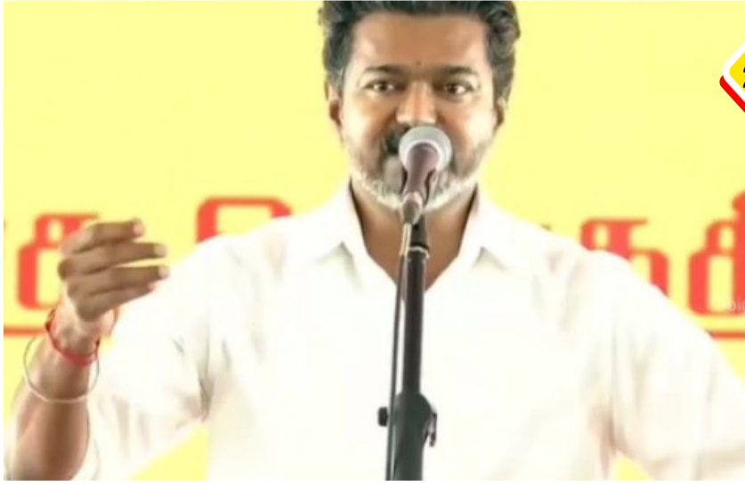
తమిళనాడులో రాజకీయ పోరు ఇకపై డీఎంకే, డీఎంకే మధ్య మాత్రమేనని ఆ రాష్ట్ర ముఖ్యమంత్రి, డీఎంకే అధినేత విజయ్ అన్నారు. ఎన్డీకల్లో ఘన విజయం సాధించిన తర్వాత సోమవారం తొలిసారిగా