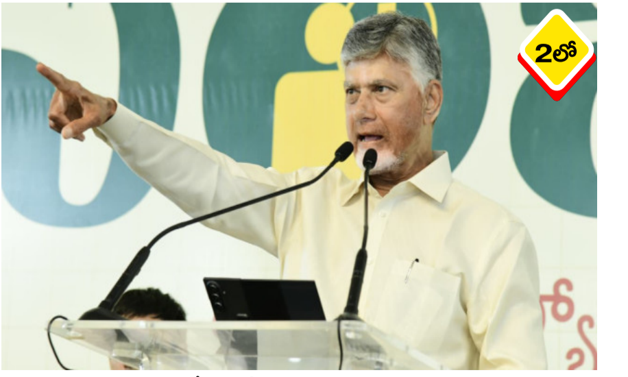
కూటమి ప్రభుత్వం రాష్ట్రంలో సుపరిపాలనా రాక్షసుల్లా ఆటంకాలు సృష్టిస్తున్నారని ముఖ్యమంత్రి యజ్ఞం చేస్తుంటే, ఓటమిని ఊర్ధించుకోలేని వైసీపీ నేతలు చంద్రబాబు తీవ్రస్థాయిలో ధ్వజమెత్తారు.