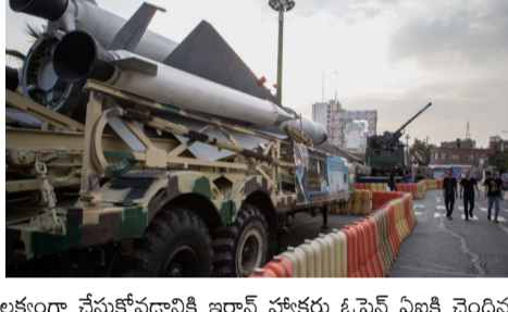
అమెరికా ఆక్షలలో సకలమతమవుతున్న ఇరాన్.. పశ్చిమ దేశాల సాంకేతికతనే ఆయుధంగా మార్చుకున్నట్లు తెలుస్తోంది. అమెరికా, ఇజ్రాయెల్ లను లక్ష్యంగా చేసుకోవడానికి ఇరాన్ పశ్చిమ ఓపెన్ ఏఐ చేందిన 'చాట్జీపీటీ', గూగుల్ కు చెందిన 'జెమినీ' వంటి ప్రముఖ ఆర్టిఫిషియల్ ఇంటెలిజెన్స్ మోడళ్లను వాడుకుంటున్నట్లు 'హైటెక్ టైమ్స్' నివేదిక సంచలన విషయాలను బయటపెట్టింది. వీటి - మగతా 2 లో