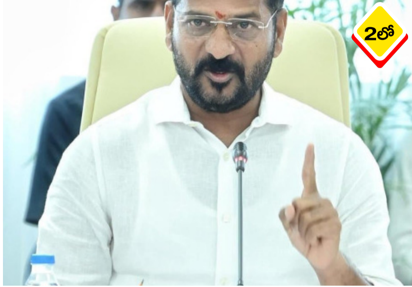
నెల రోజుల్లోనే ఇందిరమ్మ ఇల్లు కట్టుకునేలా కొత్త సాంకేతికతను తీసుకువస్తున్నామని తెలంగాణ ముఖ్యమంత్రి రేవంత్ రెడ్డి అన్నారు. కొమురంబీమ్ అసిఫాబాద్ జిల్లాలో ముఖ్యమంత్రి